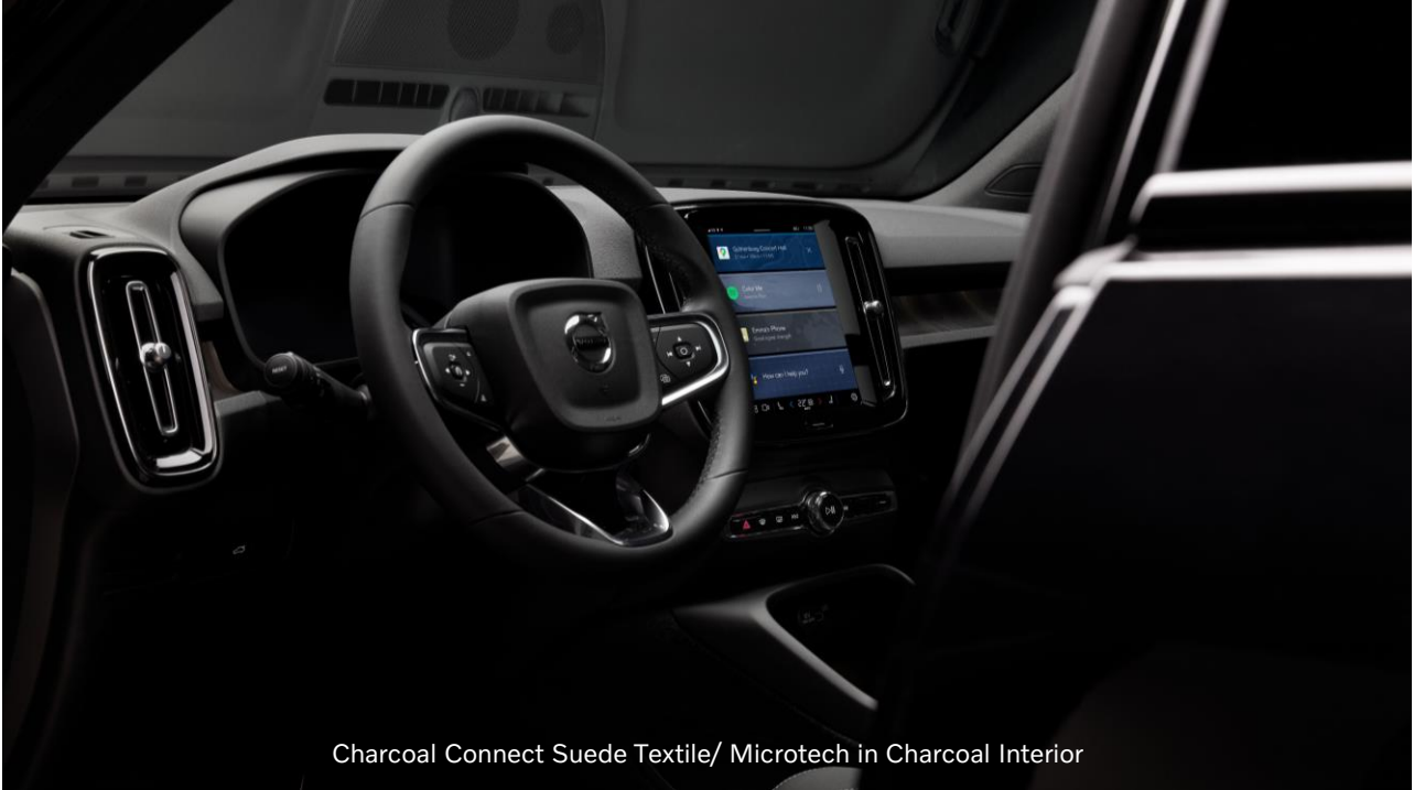
Charcoal Connect Suede Textile/ Microtech in Charcoal Interior