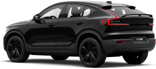
Onyx Black Metallic