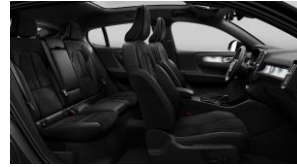
Charcoal Connect Suede Textile/ Microtech in Charcoal Interior