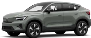
Sage Green Metallic