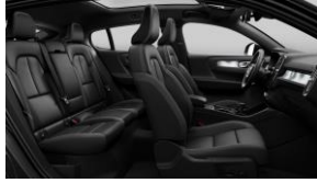
Charcoal Fusion Microtech/ Textile in Charcoal Interior