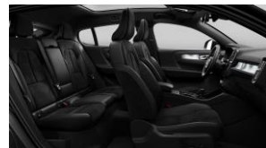
Charcoal Connect Suede Textile/ Microtech in Charcoal Interior