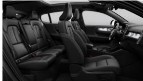
Charcoal Fusion Microtech/ Textile in Charcoal Interior