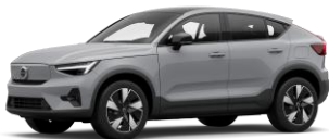
Vapour Grey Metallic