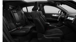
Charcoal Connect Suede Textile/ Microtech in Charcoal Interior