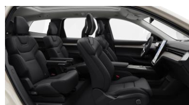
Ventilated Charcoal Nordico in Charcoal interior