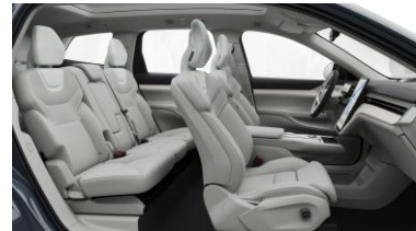
Ventilated Dawn Nordico in Dawn interior