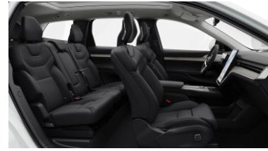
Ventilated Charcoal Nordico in Charcoal interior