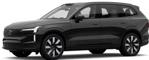
Onyx Black Metallic