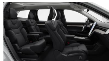
Ventilated Charcoal Nordico in Charcoal interior