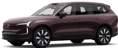
Mulberry Red Metallic