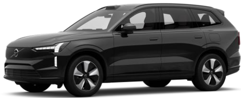
Onyx Black Metallic