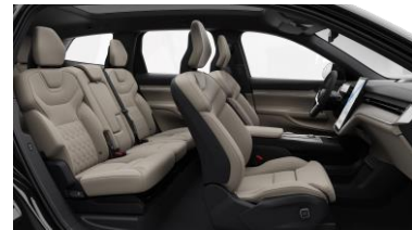
Cardamom Quilted Nordico in Charcoal/Cardamom interior