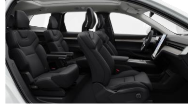
Ventilated Charcoal Nordico in Charcoal interior