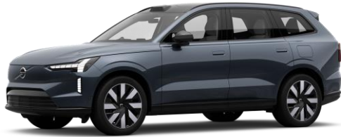
Denim Blue Metallic