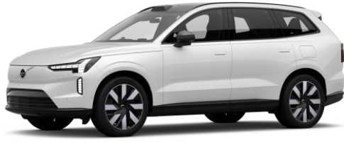
Crystal White Premium Metallic