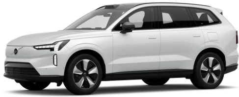
Crystal White Premium Metallic