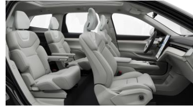
Ventilated Dawn Nordico in Dawn interior