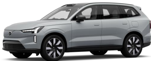
Vapour Grey Metallic